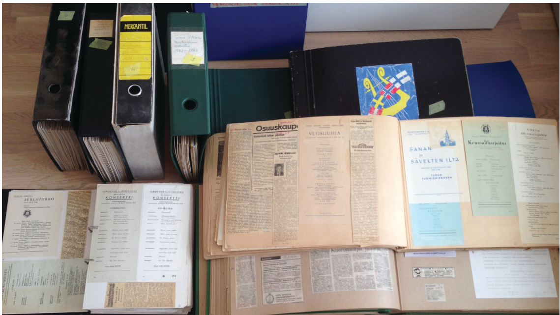
Kuva 1. Arkistomateriaalia: vasemmalla Paavo Läntisen koostamia leikkeitä arkistomapeissa. Oikealla kuoron leikekirjoja, joista vanhin auki päällimmäisenä esimerkkiaukeamalta 42–43, joka sisältää niin lehtileikkeitä kuin käsiohjelmaa vuodelta 1949.

Edellä esitetyn leikekirjasarjan lisäksi Kuoron I basson äänenvalvojana vuoden 1969 juhlakonserttiohjelmassa mainittu veturinkuljettaja Paavo Läntinen on tehnyt huolellista työtä koostamalla viisi arkistomapeillista kronologisesti järjestettyjä ohjelmalehtisiä ja lehtileikkeitä kuoron toiminnasta vuodesta 1932 aina vuoteen 1986 saakka (Arkistolähteet 1–5). Nämä kaksi leikekirjasarjaa täydentävät toisiaan ja luonnollisesti sisältävät runsaasti myös samoja leikkeitä. Arkistoaineistoa on nähtävillä kuvassa 1.