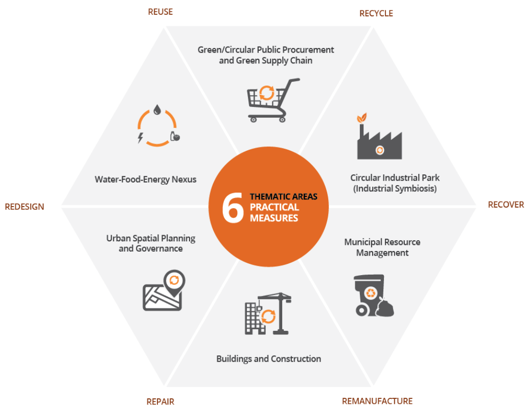
Kuva 1. ICLEI temaattiset sektorit ja käytännön toimenpiteet 3

ICLEI on määritellyt kuusi temaattista sektoria kiertotaloustoiminnan toteuttamiseksi: