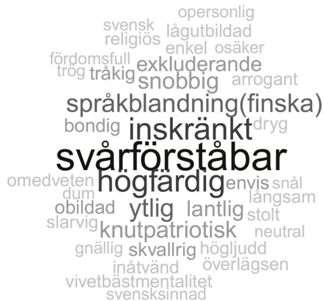
Figur 4. Negativa stereotypier.