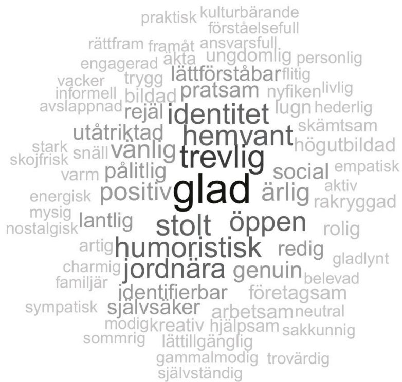
Figur 3. Positiva stereotypier.