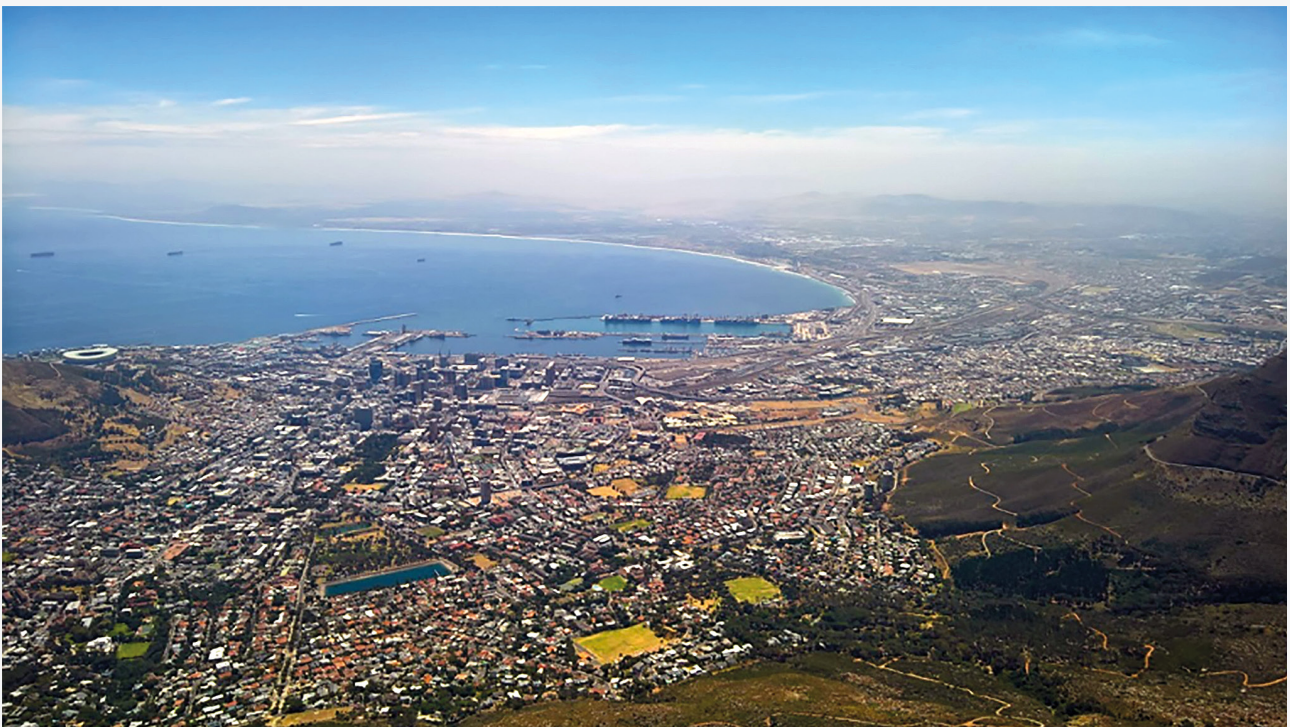
Pöytävuorelta avautui upea maisema Kapkaupungin yli, mikäli ”pöytäliina” (pilviverho) ei peittänyt näkymää.