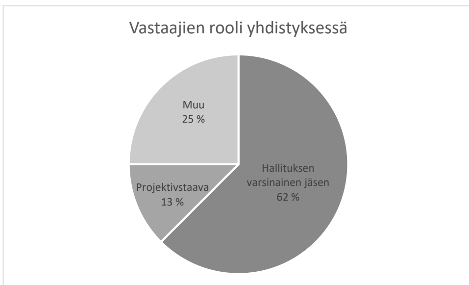
Kuva 3.1.3. Sähköisen kyselyn vastaajien rooli edustamassaan yhdistyksessä tai verkostossa.