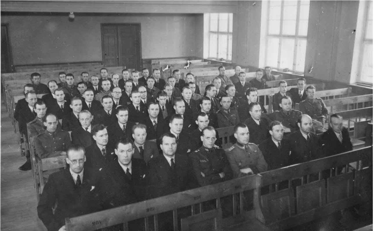
Summan ristin perustamistoimikunta Tampereella 27.10.1940.