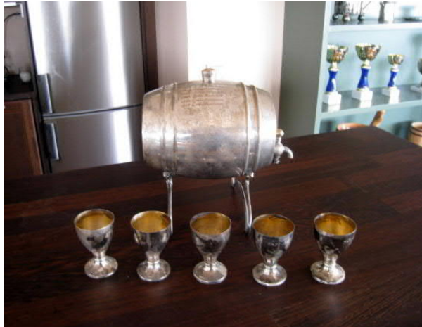
Sarren tynnöri ja pikarit Porin Reserviupseerikerho ry:n tiloissa.

Sekä aineettomaksi että aineelliseksi kulttuuriperinnöksi voi mielestäni laskea ne lukuisat puheet ja esitelmät, joita Sarre vuosien varrella piti. Hän oli varsin suosittu puhuja niin vuosijuhlissa kuin pienemmissäkin tilaisuuksissa. Puheista ja esitelmistä oli arkistossa paperilla vain murto-osa, mutta yhdistysten historiikeista ja kokousten pöytäkirjoista kävi ilmi, että Sarre oli pitänyt lukuisia puheita ja esitelmiä. Arkistossa on säilynyt mm. juhlapuhe Porin Metsästysseuran 60-vuotisjuhlassa Ruotsalaisella Klubilla 9.4.1950. Se oli koneella kirjoitettu yhdeksänsivuinen puhe, jossa Sarre ensin kertoi Laatokan rannoista vuonna 1940, näkemästään jäniksestä ja Konevitsan kirkon tornien loisteesta auringon paisteessa. Sitten hän siirtyi kertomaan millainen ihminen on 60 -vuotiaana. Lääkärin tuntemuksella hän kertoi sairauksista, joita tässä iässä voi olla: verisuonten kalkkeutumista, väsymyksen tunnetta, ehkä liikalihavuuttakin. Tästä hän pääsi mukavasti kertomaan 60-vuotiaasta seurasta. Kuinka se on parhaassa vireessään ja vankalla pohjalla. Talouteen liittyvistä asioista hän siirtyi taitavasti kertomaan metsästystovereiden, luonnon ja riistan kunnioittamiseen. Puheen hän päätti sanoihin: