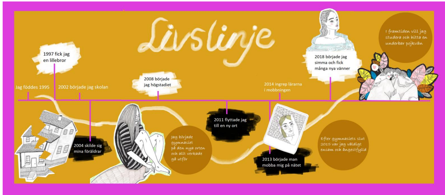
Figur 1. Livslinjen för vuxen