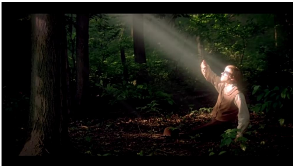
Kuva 2 ruutukaappaus Smithin ensimmäisestä näystä

Kuva 2 esittää Joseph Smithin ensimmäistä näkyä Jumalasta ja Jeesuksesta. Tämä tapahtuu elokuvan alussa, missä Smith on vielä 14- vuotias nuori poika. Smith on ennen tätä kohtausta miettinyt paljon, mikä kaikista kristillisistä kirkoista on oikeassa. Elokuvassa hän lukee Raamatusta jakeen Jaakobin kirjasta ja päättää sen perusteella rukoilla Jumalalta vastausta tähän kysymykseen. Hän menee kotinsa läheiseen lehtoon ja polvistuu rukoukseen. Ennen Jumalan ja Jeesuksen ilmestymistä, näytetään elokuvassa Saatanan kiusaavan häntä, eli kuva muuttuu tummaksi ja pimeäksi ja Smith näytetään peloissaan ja kivussa, kunnes yhtäkkiä taivaalta osuva valo Smithiin ajaa Paholaisen pois ja Smithin yläpuolelle ilmestyy kaksi valossa kylpevää hahmoa, jotka ilmoittavat hänelle olevansa Jumala ja Jeesus Kristus. Hahmoilla on päällään valkoiset, toogamaiset viitat.