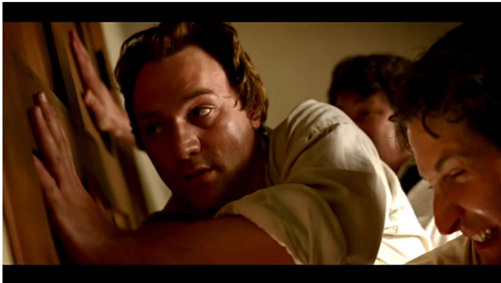
Kuva 10 ruutukaappaus Smithin marttyyrikuolemasta Carthagen vankilassa

teokraattiseen hallintoon (Bushman 2005, 523–524). Tässä kohtauksessakin, josta olen analysoivan otoksen ottanut, on mahdollista nähdä, miten mormonit kohtelevat Smithiä ei pelkästään profeettana vaan myös joukkonsa hallitsijana, kuninkaana.