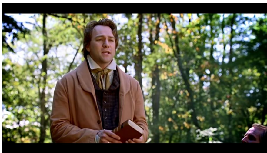
Kuva 5 ruutukaappaus Smithin saarnasta

Ikonografiassa kultalevyt voidaan tulkita tietynlaiseksi mormonien tunnusmerkiksi, joka erottaa kultalevyt muista kristillisistä uskonnoista ja sitoo ne esimerkiksi vahvasti Vanhan testamentin kymmeneen käskyyn, jotka kaiverrettiin kivilevyille (Ockenström & Fält 2012, 194). Mormonikirkossa kultalevyjen kääntäminen on monelle osoitus siitä, että Joseph Smith oli Jumalan kutsuma profeetta, joten tieto siitä, että oliko kyseisiä kultalevyjä edes olemassa ja niiden kyseenalaisesta ”kääntämisestä” hatun ja kiven avulla, on voinut horjuttaa joidenkin uskoa Smithiin profeettana (Östman 2019, 144–145).