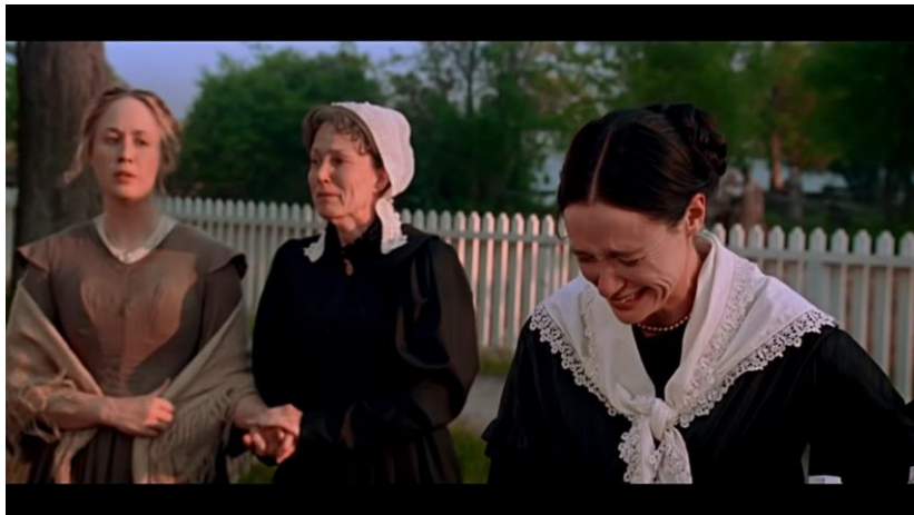
Kuva 13 ruutukaappaus Emmasta itkemässä sanoessaan hyvästit Smithille