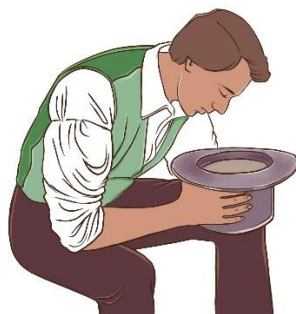
Kuva 2 näyttää, miten käännöstyö todellisuudessa tapahtui, eli Smith laittoi kiven hatun sisään ja ”katsoi” hattuun Taide: Pauliina Holopainen

Ohessa on kaksi taiteilijaystävänäni tekemää piirrosta siitä, miten mormonien pyhän kirjan, Mormonin kirjan, kääntäminen on esitetty kirkon jäsenille. Kuva 1, jossa Smith sanelee