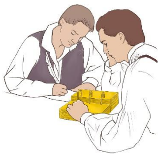
Kuva 1 esittää Mormonin kirjan käännöstyötä kuten se näytetään mormonien maalauksissa