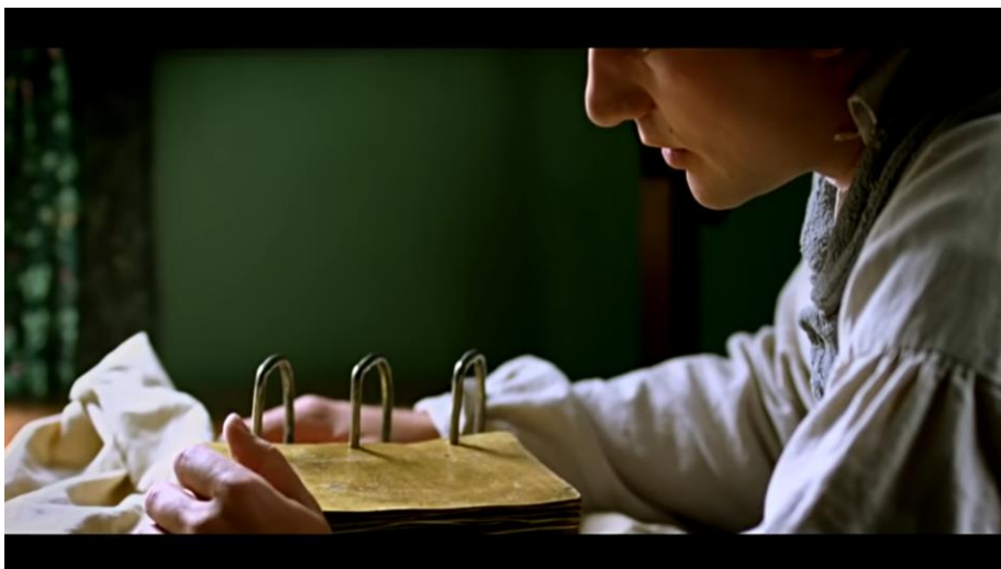
Kuva 4 ruutukaappaus kultalevyjen kääntämisestä

Mielenkiintoista kyllä emme elokuvassa koskaan näe sanansaattajia selvästi, olivat he sitten jumalolentoja tai enkeleitä, kun taas mormonien tekemissä maalauksissa jumalten ja enkelten kasvot ovat hyvin selkeästi näkyvissä. Ikonografiassa analyysin keinona käytetään taideteosten henkilöitä, jotka jaetaan eri luokkiin edustamaan esimerkiksi uskonnollisia, historiallisia tai mytologisia hahmoja ja analyysissa käytetään myös piirteitä, jotka liittyvät näihin hahmoihin ja niitä käsitteleviin myytteihin (Ockenström & Fält 2012, 193–194). Nämä piirteet voivat liittyä esimerkiksi vaatetukseen tai esineisiin, joita taideteoksen hahmolla on (Ockenström & Fält 2012, 194). Kristillisissä maalauksissa yleisin piirre, joka yhdistää maalausten hahmoja, on heitä ympäröivä sädekehä ja tämä sädekehä osoittaa heidän olevan pyhimyksiä (Ockenström & Fält 2012, 194). Mormonimaalauksissa ei näy sädekehiä vaan sen sijaan enkelit ja sanansaattajat kuvataan valon ympäröimänä mutta myös ihmiskasvoilla ja tämä on saattanut olla jonkinlainen versio kristinuskossa nähtävässä pyhimysten sädekehistä.