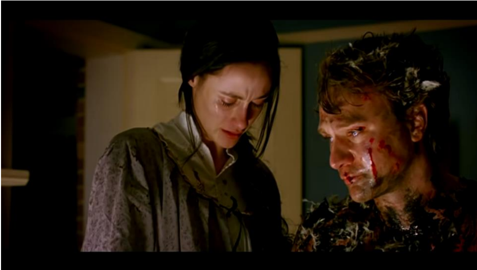
Kuva 6 ruutukaappaus Emmasta puhdistamassa Josephia tervasta ja höyhenistä

Tämän kuvan konteksti tulee Smithin tervauksen ja höyhennyksen yhteydessä. Elokuvan mukaan joukkio likaisia ja mutaisia miehiä, joilla useimmilla on parta, hyökkäsivät Smithin asuintaloon keskellä yötä ja raahasivat hänet sängystä ulos. Ulkona he tervasivat ja höyhensivät hänet, vaikka sitä ei kohtauksessa kovin yksityiskohtaisesti näytetä. Emma, Smithin vaimo kuvassa 6, puhdisti Smithiä tästä liasta ja haavoista. Smithin tervalle ja höyhennykselle annetaan syyksi hänen uskonsa, joka poikkesi muista uskonnoista, ja hänen vainoajansa kuvataan pahoina ihmisinä, jotka hyökkäsivät hänen kimppuunsa ilman todellista syytä. Kohtauksessa myös näytetään Smithin perheen itkevä vauva ja Emma kyyneleissä, kun hän katsoo kauhuissaan Smithiin kohdistuvaa hyökkäystä ovensuussa. Tämän on luultavasti ollut tarkoitus tuottaa maksimaalinen sympatian tunne Smithiä kohtaan ja inho hyökkääjiä kohtaan.