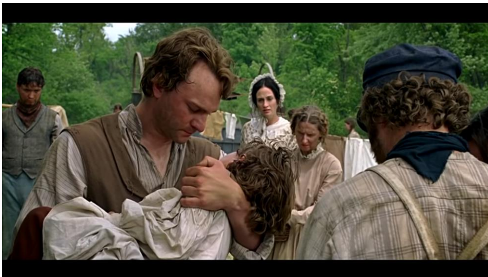
Kuva 9 ruutukaappaus Smithin ”ihmetöistä”

Kuva 9 tapahtuu Smithin vangitsemisen ja vapautumisen jälkeen. Suurin osa mormoneista muutti Nauvooseen, Illinoisiin, vainojen seurauksena ja monet heistä sairastuivat tauteihin leireissä, joissa asuivat. Elokuvasa Smith siunaa sairaita ja antaa heille lohdun sanoja ja sylissänsä pitämänsä pienen pojan tapauksessa myös parantaa sairaita. Smithin äiti toimii tässäkin kohtauksessa kertojana, kuten suurimman osan elokuvasta, ja hän miettii mielessään, kuinka Joseph on todellakin Jumalan profeetta ja valittu, joka ravitsee mormonien sieluja.