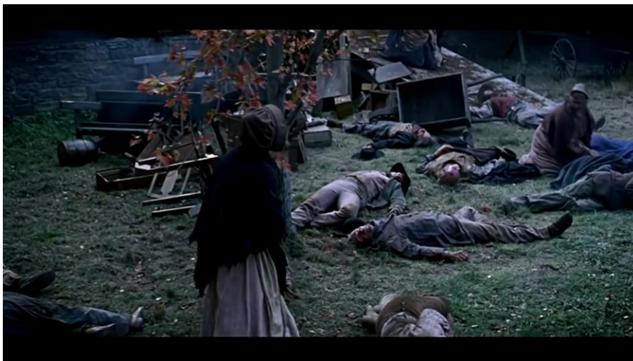
Kuva 7 ruutukaappaus Haun's Millin surmista

Moniavioisuus oli myös iso osa Smithiin liittyvistä vainoista. Muun muassa elokuvassa tapahtuva terva ja höyhennys tapahtui osaksi juuri moniavioisuuden takia, koska kirkon ulkopuolinen väkijoukko uskoi, että Smithillä oli sopimattomia suhteita naimattomiin naisiin (Newell & Avery 1994, 65). Smith yritti moniavioisuutta ensimmäisen kerran jo varsin varhain, joidenkin tekstien mukaan jo vuonna 1835, mutta virallisesti kielsi pitkään harjoittavansa moniavioisuutta sekä mormoneille että kirkon ulkopuolisille (Newell & Avery 1994, 67). Elokuvassa tätä moniavioisuutta ei kuitenkaan näytetä, joten katsojalle mormonien ja erityisesti Smithin vaino jää yksinomaan mormonikirkon ulkopuolisten syyksi.