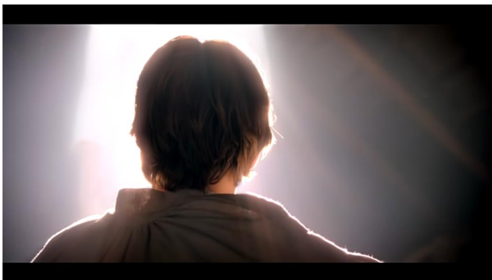
Kuva 3 ruutukaappaus sanansaattajan kohtaamisesta