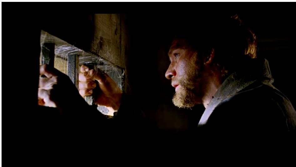
Kuva 8 ruutukaappaus Smithistä vankilassa

Tämä kuva 8 esittää Smithiä vankilassa, jonne hänet on heitetty veljensä Hyrum Smithin kanssa. Heidät vangittiin Missourissa, elokuvan mukaan väärin perustein, ja ennen tyrmään heittämistä he makasivat kahleissa muiden vankien kanssa heidän vangitsijoidensa juudessa ja kertoessa irstaita tarinoita mormoneista. Josephin näytetään nuhtelevan kahleissa vangitsijoitaan tästä käytöksestä. Vankila näytetään hyvin pimeänä maanalaisena kellarina, jonne kaltereiden läpi paistava aurinko tuo tietynlaisen toivon valon eli jumalallisen valon, joka antaa lohdun ja ilmestyksen sanoja Jumalalta Smithille. Tämäkin kohtaus esiintyy jonkin verran mormonimaalauksissa.