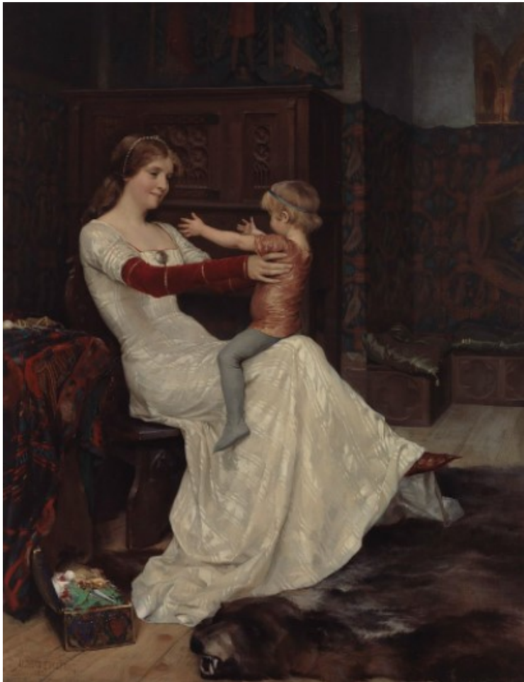
Kuva 2. Pyhälle Birgitalle läheiseksi tullut Ruotsin kuningatar Blanka Namurilainen Albert Edelfeltin kuvaamana 1877. Suomen kansallisgalleria.