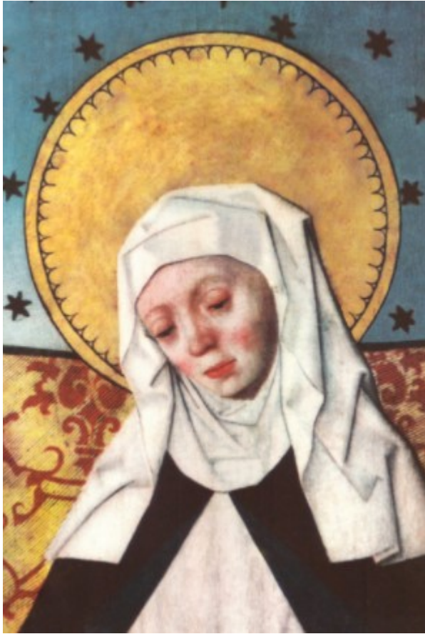
Kuva 3. Pyhä Birgitta, Salemin kirkon alttarikaappi, 1400-luvun loppu. Wikimedia Commons.

activan . 204 Uskonnollisista näyistä tuli naisille suhteellisen yleisesti hyväksytty tapa ottaa paikkansa maailmassa ja vaikuttaa yhteiskuntaan. 205