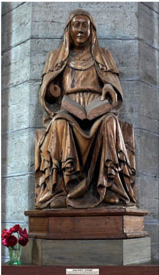
Kuva 1. Pyhä Birgitta Vadstenan luostarikirkossa. Wikimedia Commons.

esimerkiksi birgittalaisluostarien, Vadstenan ja Naantalin välillä). 95 Vaikka kirjoitus- ja lukutaito olivat keskiajan Ruotsissa harvinaisia, jopa ei-haluttavia taitoja naiselle, ei aatelistyttöjen lähettäminen luostarin kouluun 7—12 vuoden iässä ollut epätavallista; 96 luostareissa naiset opettelivat hengellisen kirjallisuuden, kristinopin ja kirjallisten taitojen ohella myös arvostettuja käsityötaitoja ja puutarhanhoitoa. 97