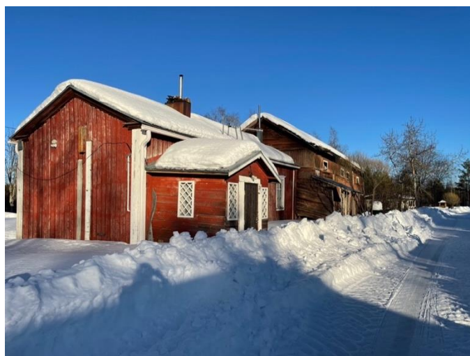
Kuva 2: Saarelan tilan asuinrakennus Perhossa talvella vuonna 2022.