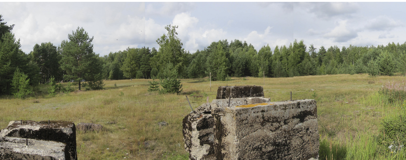
Kuva 2. Piretanniemi loppukesästä 2011. Kuvan edustalla sahaan kuuluneita rakenteita. Hautausmaa-alue on sijainnut ainakin osittain sahan alueella. Jäänteet kappelin mahdollisesta kivijalasta löytyivät rakenteiden takaa aukealta koivun ympäristöstä.