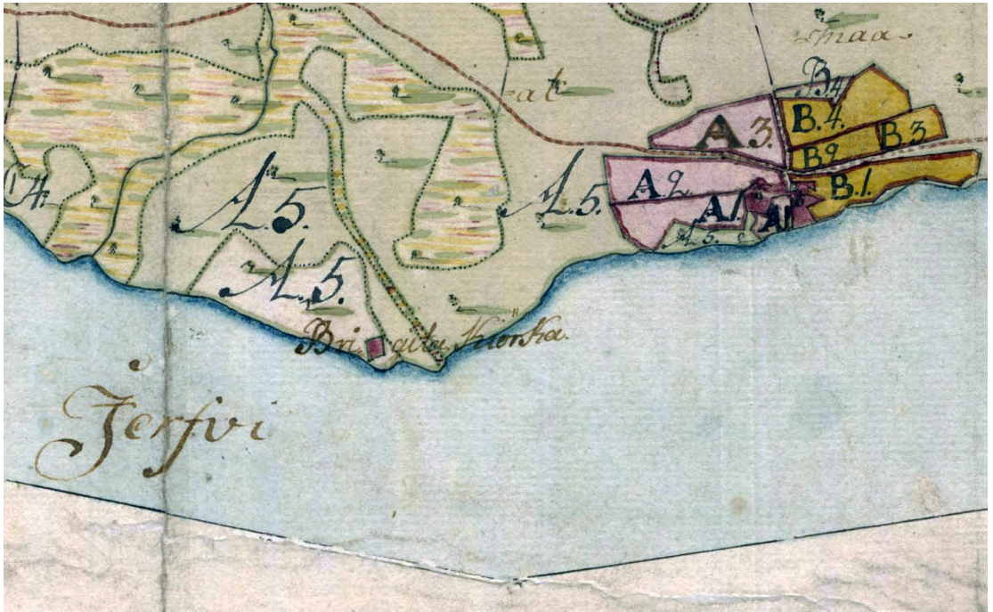
Kartta 2. Ote Kaukjärven itäpuolen kylää kuvaavasta 1770-luvun verollepanokartasta (Charta öfver Talpola, Kockola, Hänniloila och Willickala Byars Ägor uti Nykyrcka sochn... MHA 125 Uusikirkko 13:1, KA). Karttaan merkity Birgitan kirkko ("Birgita Kiörka") osoittaa todennäköisesti kirkkomaan sijaintia. Oikealla Talpolan kylä.