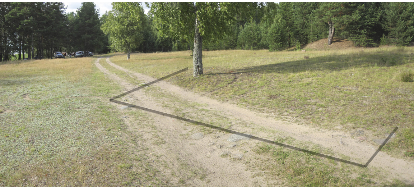
Kuva 3. Tieurasta paljastuneen itä-länsisuuntaisen kivijalan länsipääty. Seinälinja vahvistettu kuvaan.

1937; SKS KRA Kuolemajärvi. Ulla Mannonen 10534. 1939). Sahaa ei paikalle palon jälkeen enää rakennettu uudelleen.