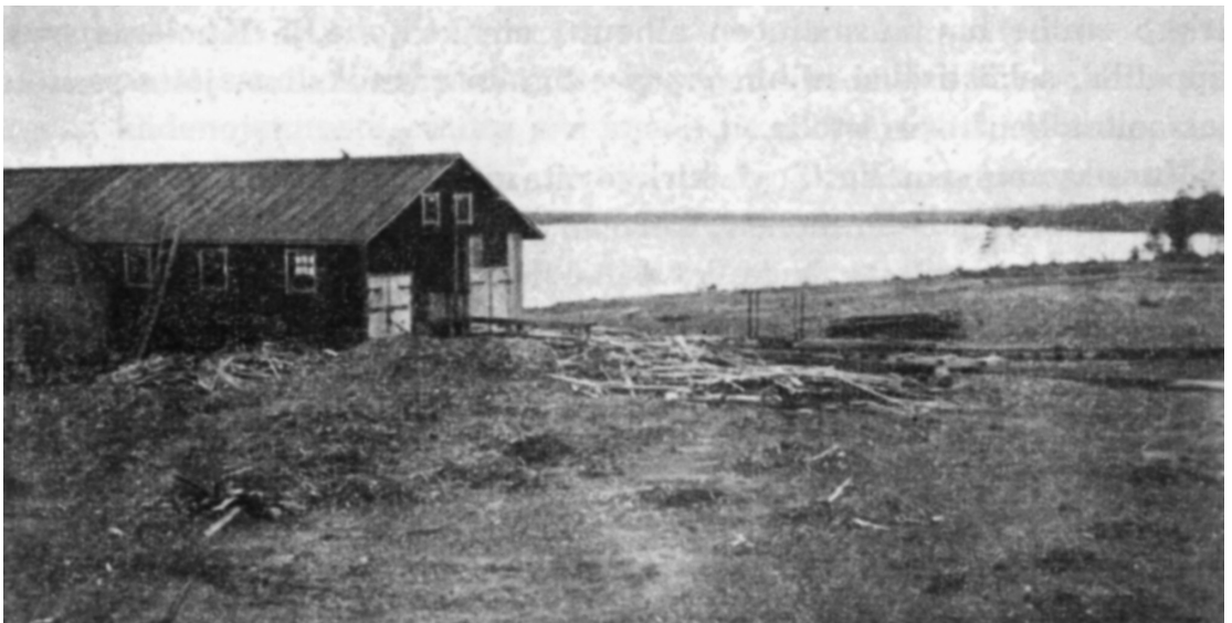
Kuva 1. Piretanniemelle perustettu saha, joka on ainakin osittain rakennettu vanhan hautausmaan päälle. Kuva todennäköisesti 1930-luvulta. Kuva teoksesta Kuolemajärvi – Historia, muistelmia ja kuvauksia (Kojo et al. 1957, 40).

Pyhän Birgitan kappelista ja sitä ympäröineestä hautausmaasta on talletettu runsaasti erilaista muistitietoa sekä paikallis- ja usko-