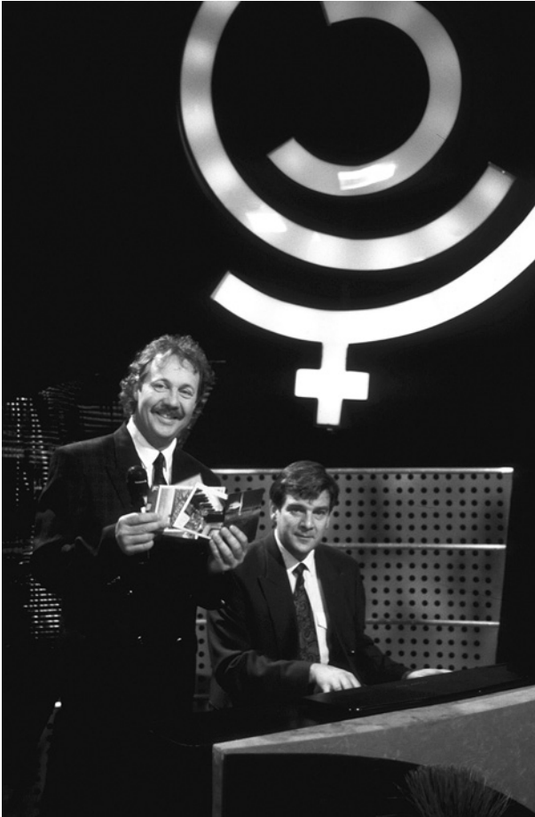
Suosittu parisuhdevisailu Napakymppi (1985–2002) nähtiin visailuohjelmille epätyypillisesti MTV:n prime timessa .

MTV:llä suuri osa lauantai-iltojen ohjelmistosta vuosina 1981–2005 oli erilaisia kotimaisia viihdeohjelmia, jotka keräsivät suuria yleisöjä. Kaupallisessa televisiossa prime time myös rajoittaa ohjelmajoihtelua siinä mielessä, että siihen voi sijoittaa vain varmoina menestyksinä pidettyjä ohjelmia. Prime timeen panostetaan kanavan suurimmat