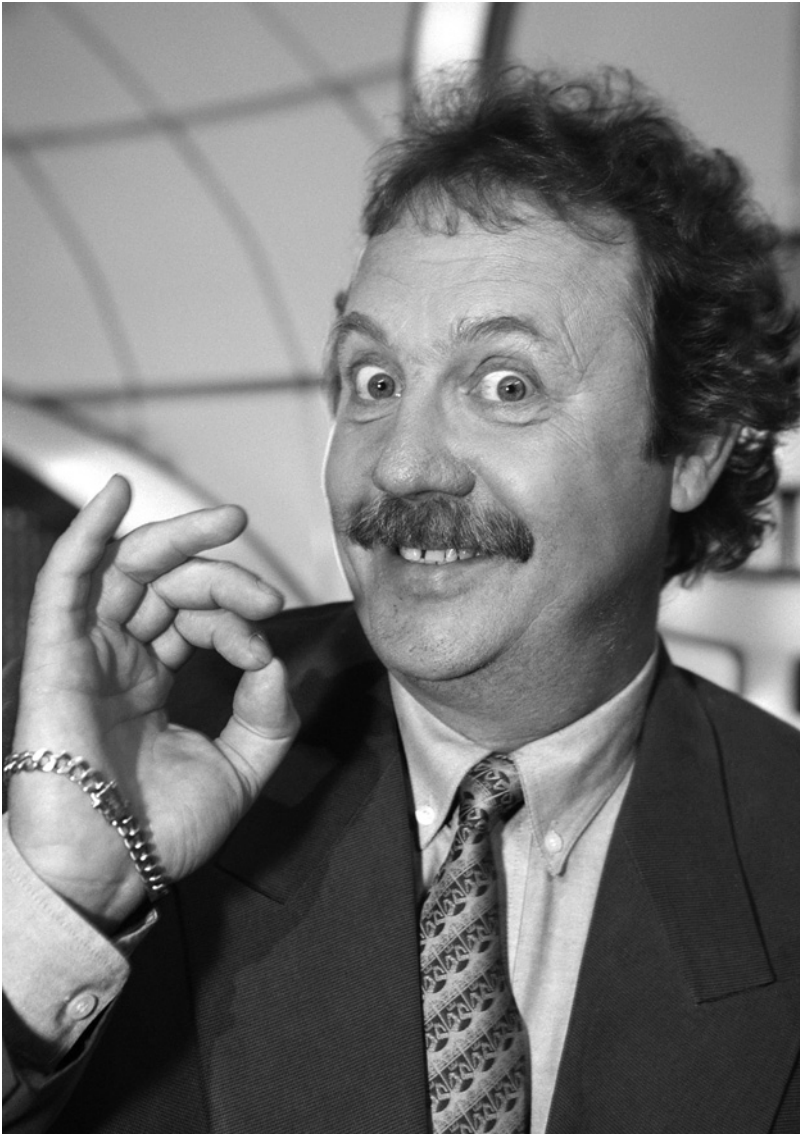
Kari Salmelaisen juontama Napakymppi oli Suomen katsotuin ohjelma vuosina 1987 ja 1990.

uutuusien jatkuvaan virtaan talouden kasvun takaamiseksi. Colin Campbell on erottanut uutuuden käsitteestä modernin kulutuksen dynamiikalle keskeisen kokemuksellisen puolen, joka ei viittaa uutuuden tuoreuteen tai innovatiivisuuteen vaan vierauden ja oudon tuomaan elämykseen. Tuttu ja turvallinen on tylsää, edelläkävijä janoaa muodin uusimpia asioita koettavakseen. (Campbell 1992, 52–57.) Edelläkävijöistä haluttuna kohderyhmänä puhutaan MTV:llä jo 1980-luvulla; uutuustuotteiden mainoksia halutaan yleisesti sijoittaa uutuusohjelmien kylkeen.