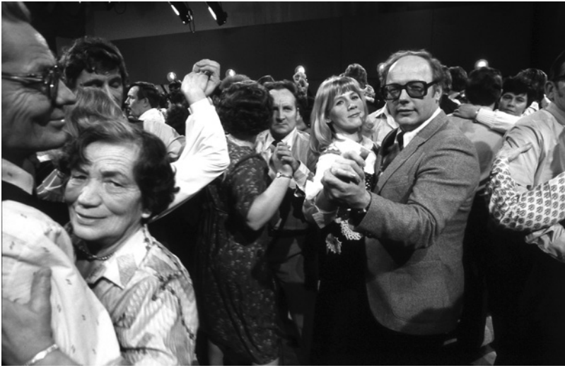
Lauantaitanssien (1971–1985) sijoittelu MTV:n lauantai-iltaan vaikutti ihmisten ajankäyttöön: maatilanomännät eivät suostuneet lähtemään iltalypsyille ennen kuin ohjelman viimeinen tanssi oli tanssittu.

klassinen perheyleisö sai murtumia, kun kaapeli-tv suuntasi ohjelmistoa täsmäyleisöille ja koteihin hankittiin useampia tv-vastaanottimia, mikä mahdollisti yksilöllisen tv:n katselun perhekatselun sijaan. Suuren yleisön ajatus joutui kriisiin, kun markkinoinnissa huomio kiinnittyi katsojien määrän sijasta laatuun. Ohjelmapaikkoja ja ohjelmia määriteltiin entistä kapeampien mainostajia kiinnostavien kohdeyleisöjen kautta.