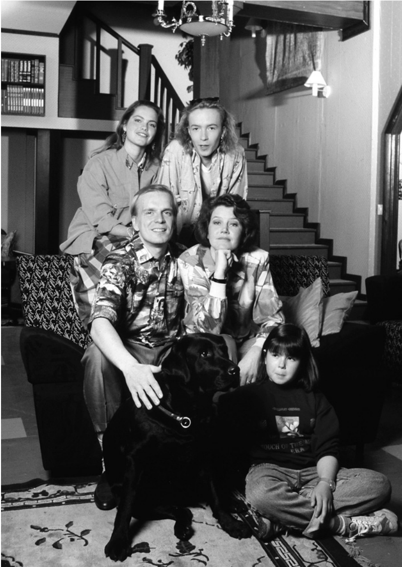
Vuoden 1990 syksyllä MTV:n lauantai-illassa näytettiin suurta suosiota nauttinutta perhesarjaa Ruusun aika (1990–1991).

Kilpailun kaudella ulkomaiset sarjat olivat kilpailuvaltteja. Keväällä 1990 lauantai-iltaan siirtyi maanantailta menestynyt Bill Cosby show (USA 1990–1992) – amerikkalainen sitcom tummaihoisesta perheestä. Ohjelmajohtaja Tauno Äijälä oli ostanut sarjan tietämättä, miten sarja vastaanotettaisiin Suomessa. Sarjasta tuli menestys, ja vasta suosion saavutettuaan se sijoitettiin lauantaille. (Tauno Äijälä 13.5.2015.) Lauantai-iltaa käytettiin myös yleisöjen keräämiseen isoille sarjahankinnoille, ennen kuin ne siirrettiin toiseen ohjelmapaikkaan; lauantai-ilta oli suurin näyteikkuna isoille panostuksille. NYPD Blue (USA 1994–1995) tuotiin lauantai-iltaan syyskauden 1994 nimekkäim-