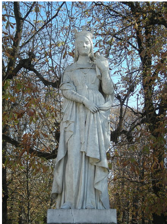
Pyhän Bathilden patsas Luxembourgin puistossa.

Klotilde ja Bathilde olivat selkeästi osa 1800-luvun kuuluisien naisten kansallista kaanonia yhdessä esimerkiksi Blanche de Castille'n (1188–1252) ja Jeanne d'Albret'n (1528–1572) kanssa, joista myös veistettiin veistokset Luxembourgin puistoon. Yhteistä naisille oli heidän instrumentaalinen rooli joko pyhimyksenä eli Ranskan kansan oikeaoppisuuden suojelijoina kuten Bathildella tai suurmiesten vaimoina ja äiteinä: Klotilde kääntyi miehensä Klodovig I:n, merovingidynastian merkittävimmän hallitsijan, katoliseen uskoon, Blanche de Castille oli Ranskan ainoan pyhimyskuningaan Louis IX:n äiti ja sijaishallitsija, ja Jeanne d'Albret oli ensimmäisen Bourbon-sukuisen hallitsijan Henri IV:n äiti. Heidän julkisessa kunnioituksessa korostui äitiyden ja uskonnollisen konservatiivin rooli, jotka olivat tärkeimmät ideaalinaisten tehtävät 1830- ja 1840-lukujen Ranskassa.[29]