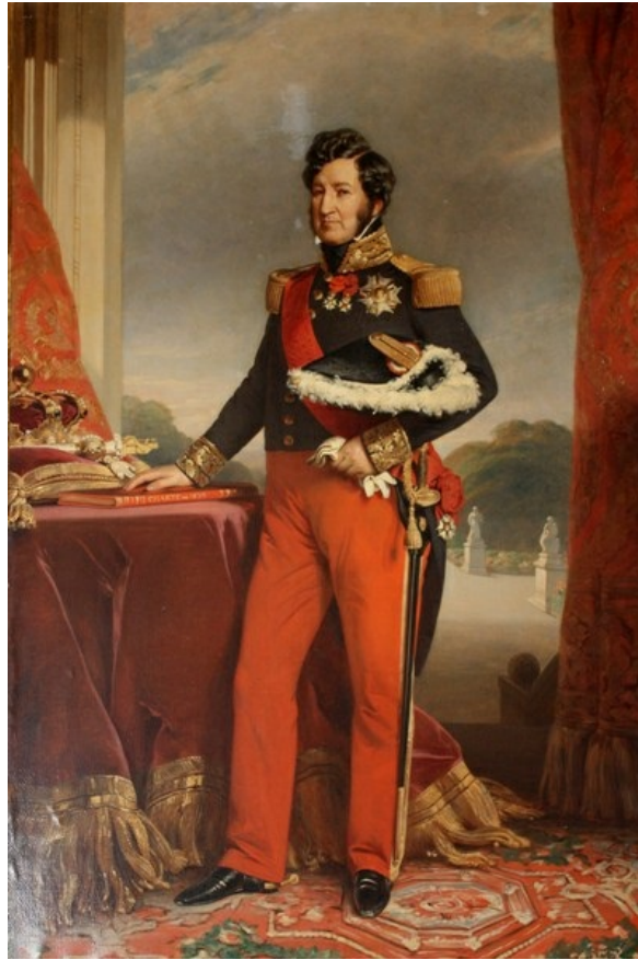
Kuningas Louis-Philippe I.

Dreux'n lasimaalaukset perustuivat piirroksiin, joiden tekijän valinta on kiinnostava. Piirustukset on tehnyt Jean-Auguste-Dominique Ingres (1780-1867), jonka taide jakoi 1830-luvun puolivälissä kriitikot poliittisten jakolinjojen myötä kun hänen työnsä Le Martyre de saint Symphorien esiteltiin vuoden 1834 Salonissa . Teos oli tilattu 1820-luvulla, jonka vuoksi teoksen nähtiin edustavan Bourbonien suvun vahvaa katolisuutta korostavaa tyyliä. Tästä syystä monet heinäkuun monarkian kannattajat sekä esimerkiksi tasavaltalaisia aatteita suosivat kirjoittajat kritisoivat sitä.[44] Kymmenen vuotta myöhemmin Ingres oli kuitenkin uuden kuningasperheen suosiossa ja hän esimerkiksi maalasi kruununprinssin muotokuvan ennen tämän kuolemaa.