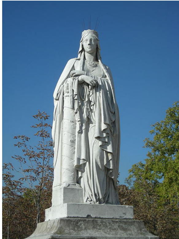
Pyhän Klotilden patsas Luxembourggin puistossa.