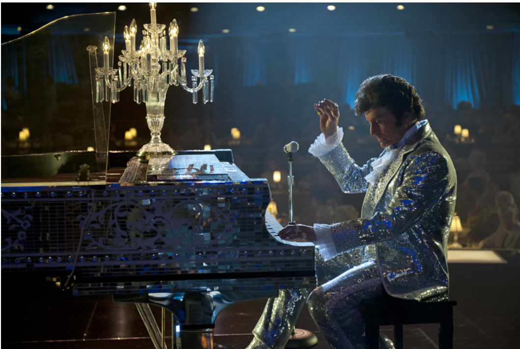
Liberacen tavaramerkki – flyygeeli ja sen päälle asetettu kynttelikkö – saavat näkyvän osan My Life with Liberace -elokuvassa.

Thatcherin isä oli säästäväisyyttä alleviivaava metodisaarnaaja, jonka viesti osui erittäin otolliseen maastoon juuri 1930-luvun pulakaudella. Ristiriitaisella tavalla Thatcheria voi kuitenkin pitää niin kasinokapitalismin synnyttäjänä kuin viktoriaanisen itsekurin puolestapuhujana aikana, jolloin kerskakulutusta ja kaupallinen media edistivät kulutusyhteiskunnan voittokulkua. Lapsuuden opit saivat hänet tavoittelemaan poliittista utopiaa, joka olisi antiteesi sodanjälkeiselle hyvinvointivaltion utopialle. Jos Liberace rikkoi esteettisen konsensuksen, Thatcher rikkoi toisen maailmansodan jälkeisen poliittisen konsensuksen väittämällä populistisesti, että jokaisella on velvollisuus hoitaa (taloudelliset) asiansa yksin ilman valtion tukea ja että valtion kukkaroa on hoidettava, niin kuin kotiäiti hoitaa omaansa.