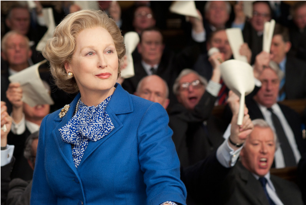
Meryl Stryypin näyttelijänsuoritus Thatcherina oli elokuvakritiikin mukaan omiaan korostamaan hahmon campmaisuu ta ja maalasi Rautarouvasta kuvan ”drag queenina”.