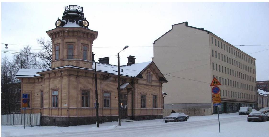
Snellun talo.

Nykyisin puutaloja on enää varsin vähän. Mieleen tulee lähinnä 1970-luvun lopussa tulipalossa tuhoutuneen ja sitä myötä puretun nuorisotalon, Kill Cityn (itse asiassa nimi Kill City kuvasi kokonaista korttelia) vieressä sijaitseva puutalo, ”Snellun talo”, Toinen linja 8, Castreninkadun kulmassa. Viimeiset Kalliossa säilyneet puutalot sijaitsevat juuri Toisen linjan loppupäässä. 33 Viimeinen kokonainen puutalokortteli purettiin 1970-luvun lopussa ja nyt korttelia ”komistaa” punainen kuntatalo 34 .