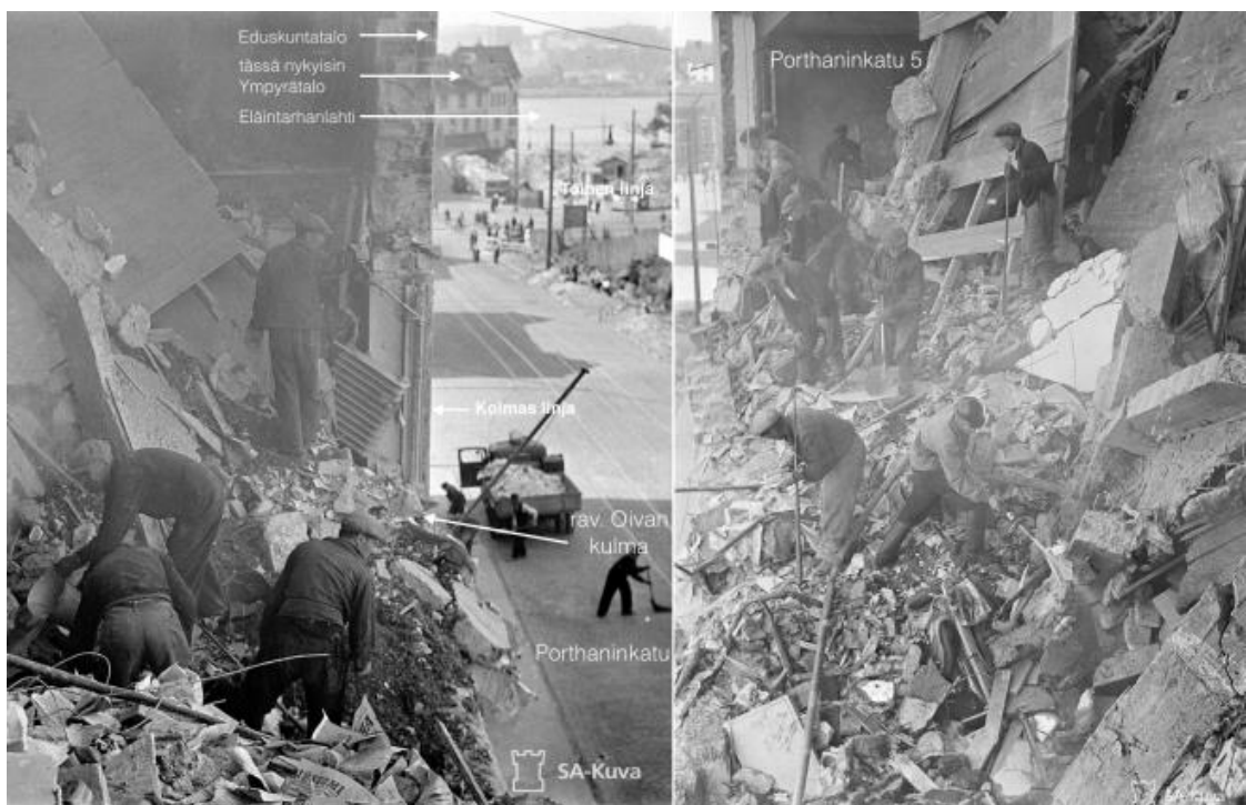
Porthaninkatu 5.