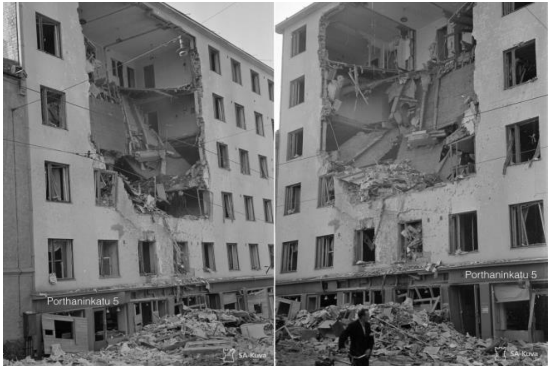
Porthaninkatu 5.