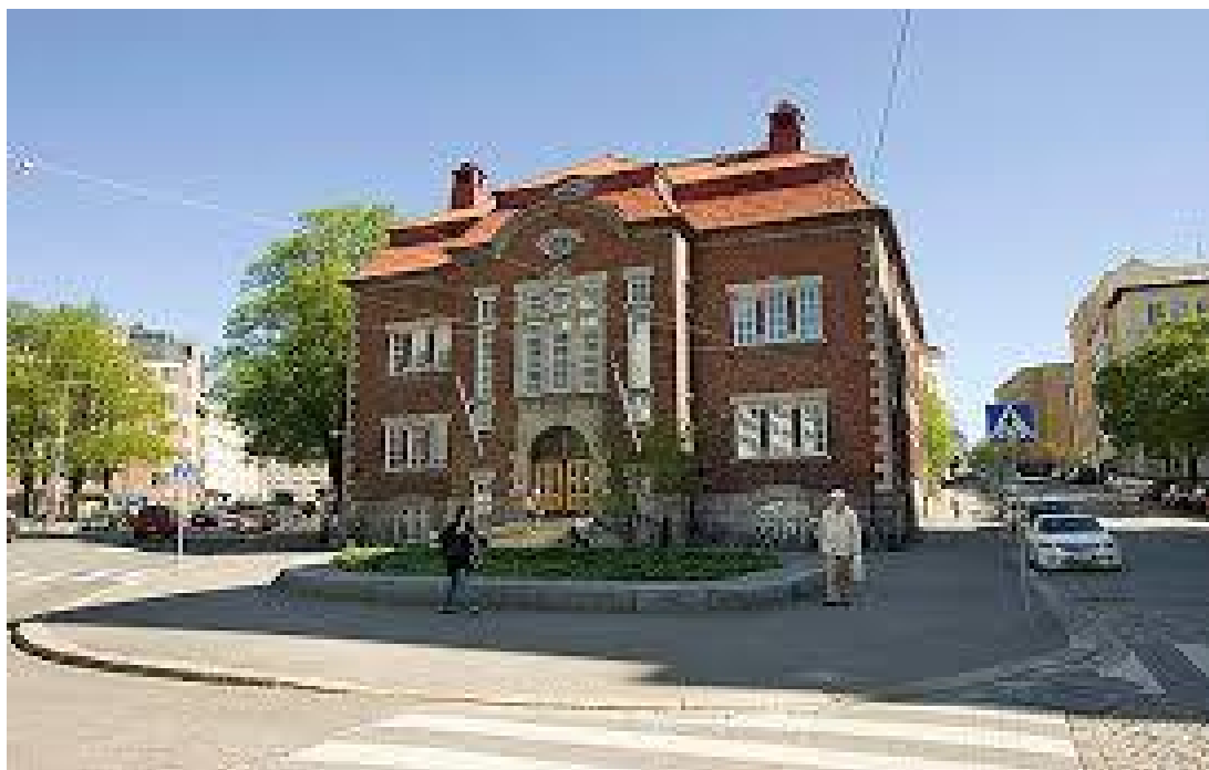
Kallion kirjasto. Helmet.fi.

Tsiigaa Reko. Joku on ottanut viimeisen huikan!