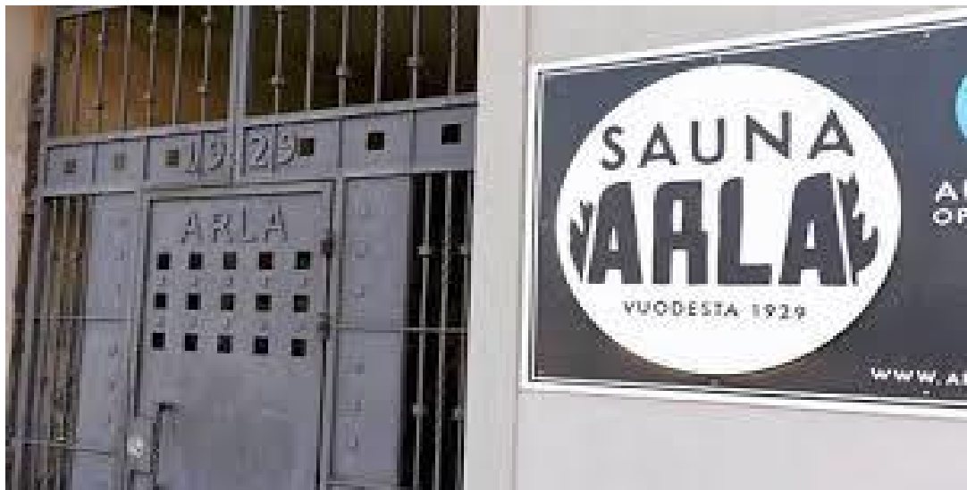
Arlan saunan julkisivu ja sisäänkäynti. is.fi