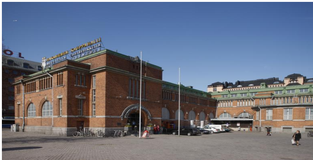
Hakaniemen kauppahalli torin reunasta kuvattuna.