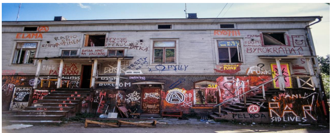
Kill Cityn purettu nuorisotalo.