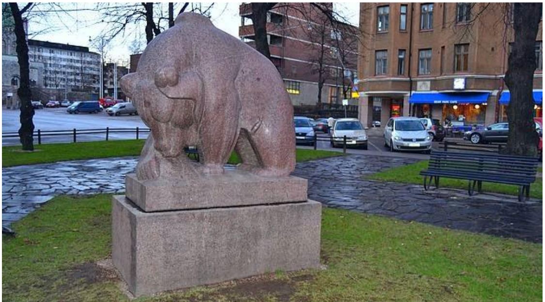
Mesikämmen muurahaispesällä. Taustalla vasemmalla kirkko ja keskellä Karhupuiston takana keskuspelastusaseman torni. Eliitin Esoteeriset Symbolit.

Muistan, kun pääsimme muutaman kaverin kanssa tutustumaan paloasemaan. Tuolloin jokaisessa teatteriesityksessä päivysti palomies ja tämä (joku heistä) oli kutsunut teatterilaisia lapsineen käymään asemalla.