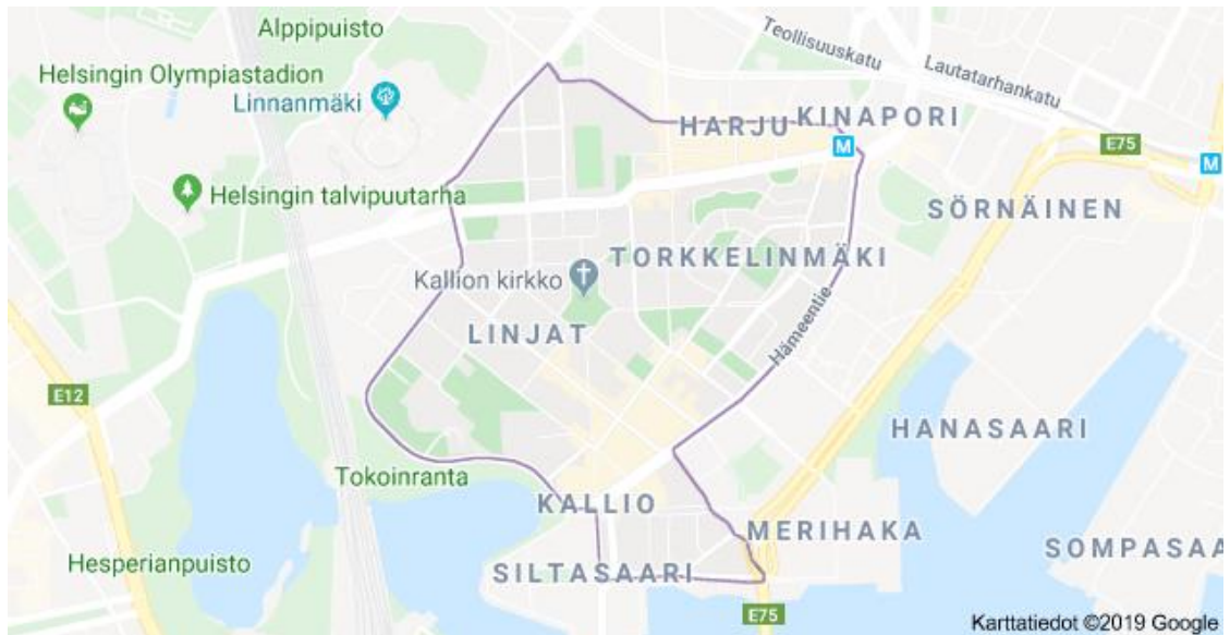
Kallion kartta. Google 2019.

Kartasta huomaa, että Kallion alueeseen on lisätty Harjukin mukaan, mutta jätetty Linjojen loppupäitä pois. Samoin läntinen osa Siltasaartakin näyttää puuttuvan. Tässä tutkimuksessa keskitytään alueen rajojen sisäpuoliseen Kallioon, joka rajoittuu etelässä Pitkäsillan pohjoispuoleen, pohjoisessa Helsinginkadun eteläpuoliseen alueeseen, kaakossa Merihakaan, idässä ja koillisessa Hämeentiehen ja lännessä Linnunlaulun siltaan. Monet haluaisivat laskea Linnunlaulun huvilatkin alueeseen, mutta tässä tutkimuksessa rajakriteerit ovat edellä mainitut. Ja Linnunlauluhan on alueena kalliolaiselle Linnunlaulua, ei Kalliota. Se on junaradan väärällä puolen ja kuuluu enemmän Eläintarhan alueeseen (älkää sekoittako millään tavoin Korkeasaareen, jossa nykyisin on oikea eläintarha).