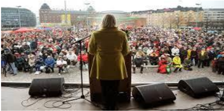
Jutta Urpilainen puhumassa Hakaniementorilla vappuna.

Yhtä lailla voin hakea Hagiksen torilta joulukuusen tai vappupallon, istua torikahvilassa tai kuunnella poliittisia puheita. Kalliossa asuessani, kävin usein vappuisin Hagiksen torilla kuuntelemassa puheita ja nauttimassa olutta erillisessä karsinassa.