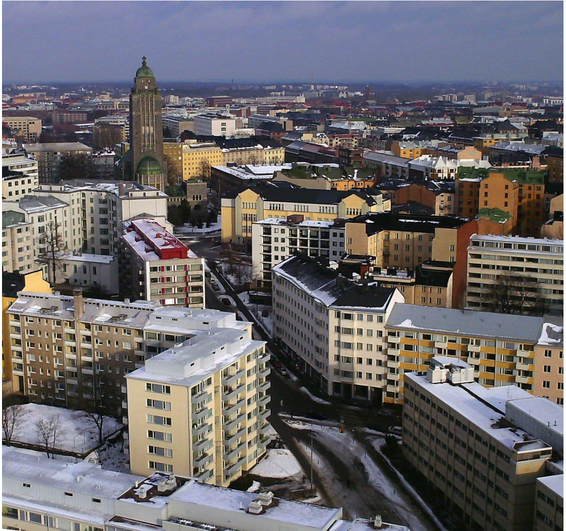
Ilmakuva Kalliosta.