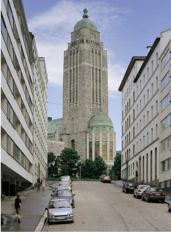
Kallion kirkko Suionionkadulta katsottuna. Kirkko ja Kaupunki -lehti. Kuvaushetki ei ole tiedossa, mutta autokantaa tarkastellen kyse ei ole ikivanhasta kuvasta. 54