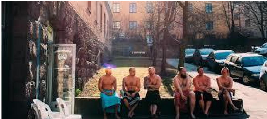
Miehiä vilvoittelemassa Kotiharjun saunan edustalla. myhelsinki.fi.