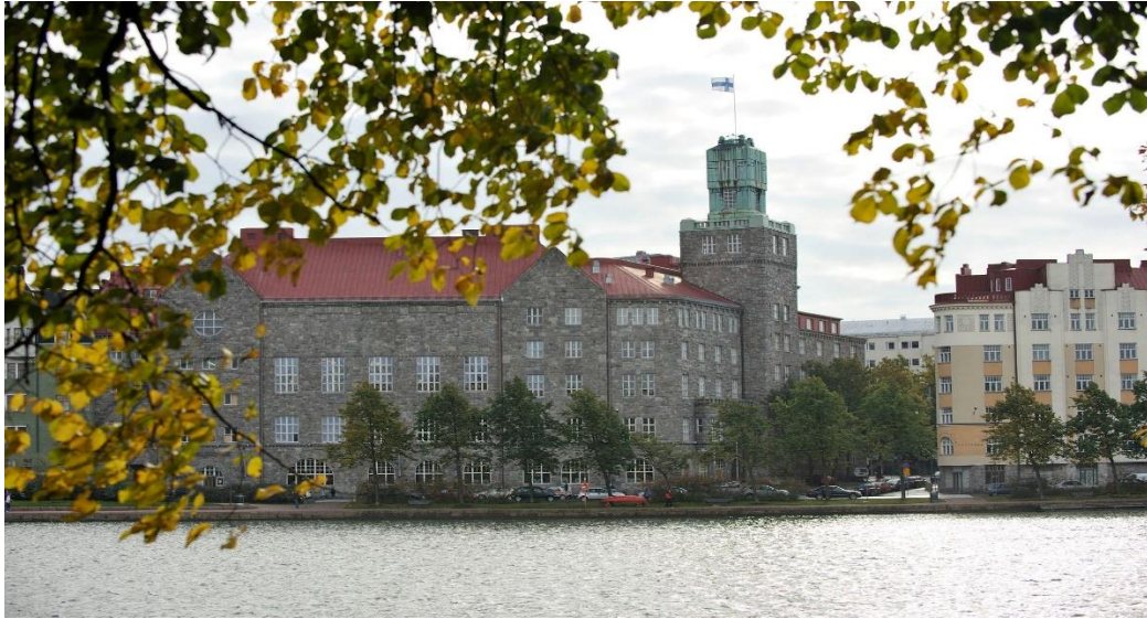
HTY:n graniittilinna Tokoinrannasta kuvattuna. Art Goes Kapakka.