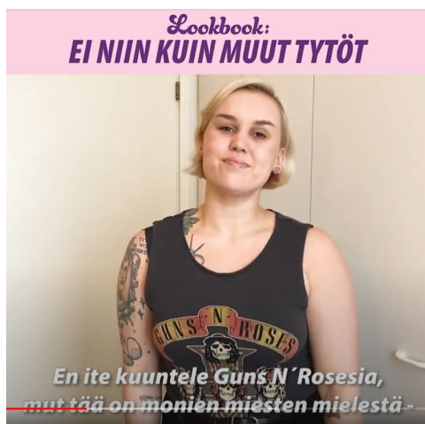
Kuva 4: Kuvakaappaus Eve Kulmalan sketsistä. Videon litterointi löytyy liitteestä 3.

Koomikko Eve Kulmala on julkaissut Instagram-tilillään pitkään sketsejä, joissa käsitellään vaikeita aiheita, kuten naisvihaa ja sisäistettyä naisvihaa. Tällä videolla (kuva 4) Kulmalan sketsissä hän esittää töihin valmistautuvaa naista, joka pukeutuu esimerkiksi katu-uskottavana pidetyn rockyhtyeen paitaan saadakseen kunnioitusta miespuolisilta työkavereiltaan. Loppukaneetissa Kulmalan hahmo naureskelee sisäistetylle naisvihalle ja lasikatoille. 54