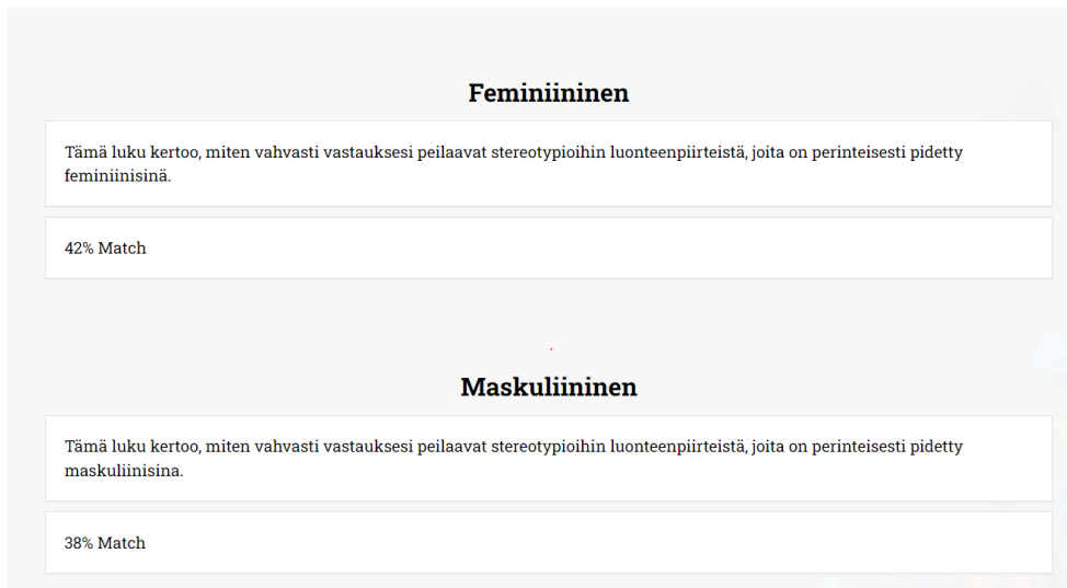
Kuva 2: Vaiheen 1 verkkotestin tulossivu.

maskuliiniselle energialle korkeamman prosenttiluvun merkiten sitä, kuinka paljon vastaaja tämän energian sanoihin täsmäsi. Kyselyä täyttäessä pyysin kanssatutkijoita lisäämään nimensä, jotta pystyin näkemään jokaisen tuloksen.