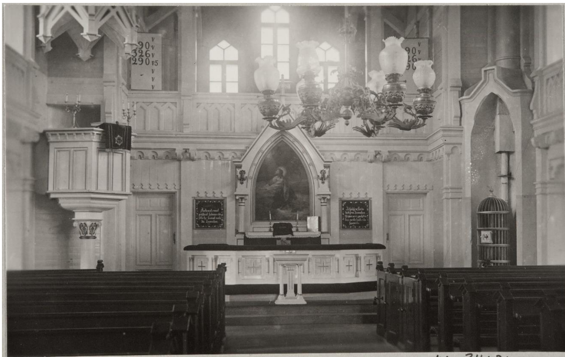
Kuva 3. Kirkon sisätila 1920–1930-luvulla.

Valokuvassa on saatettu tietoisesti kuvata kirkon sisätilaa visuaalisesta näkökulmasta, koska kuvassa ei näy ihmisiä eikä toimintaa. Tilan käyttäjät puuttuvat usein arkkitehtuuria esittävästä valokuvista. Tällä tavoin on haluttu korostaa rakennuksen arkkitehtuuria ja merkitystä monumentaalisenä taideteoksena. Valokuvat on otettu sellaisena hetkenä, kun rakennuksen sisällä tai sen ympäristössä ei liiku ihmisiä. Taidehistorioitsija Kirsi Saarikankaan mukaan arkkitehdit saattoivat olla tarkkoja siitä, kuinka heidän rakennuksiaan kuvataan ja esitetään valokuvissa. 206 Kirkkoon tilana liittyy voimakkaita visuaalisia elementtejä.