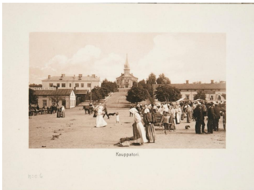
Kuva 1. Lahtelaisia kauppatorilla ja taustalla Keski-Lahden kirkko 1900-luvun alussa.

Kirkon asema 1900-luvun alun kaupunkikuvassa näkyy selkeästi kuvassa 1. 42 Kyseessä on postikorttikuva, jonka aiheena on kauppatori. Vanha puukirkko näkyy taustalla torin pohjoispuolella. Kirkot ovat olleet tyypillisesti postikorttikuvien aiheena, jolloin kuvissa korostuu kirkkorakennuksen monumentaalisuus. Historioitsija Tiina Männistö-Funkin mukaan kaupunkikuvat ja muut maisemakuvat alkoivat yleistyä 1880-luvulla postikorteissa. Tarkoituksena oli tallentaa näkymiä ja tehdä maisemia tunnetuksi. Kaupunkikuvien fokuksessa ovat yleisesti olleet kaupunkien rakennukset ja yleisnäkymät, mutta julkisella paikalla voi kuviin tallentua myös jotain tahatonta ja ennalta arvaamatonta. Historiantutkimuksen kannalta tämä satunnaisesti valokuviin tallentunut sisältö on kiinnostavaa. Kauppatoria esittävä postikorttikuva on siinä mielessä huomionarvoinen, että siinä ei kuvata ainoastaan kaupunkitilaa ja rakennuksia monumentteina, vaan esillä on ihmisiä arkisissa toimissaan. 43 Huomio kiinnittyy eläimiin eli hevoseen ja irrallaan juoksenteleviin koiriin, joten kuva avaa osaltaan myös eläinten historiaa kaupunkitilassa. Kulttuurihistorioitsija Mervi Autti on todennut, että valokuvissa esiintyvät yksityiskohdat voivat toimia tutkimuksen johtolankoina avaten uusia teemoja. Aikalaiset tuskin ovat kiinnittäneet samalla tavalla huomiota valokuvissa näkyviin yksityiskohtiin. 44 1900-luvun alussa Lahden katukuvassa ei näy vielä autoja, vaan matka taittui kävellen tai hevoskyydillä.