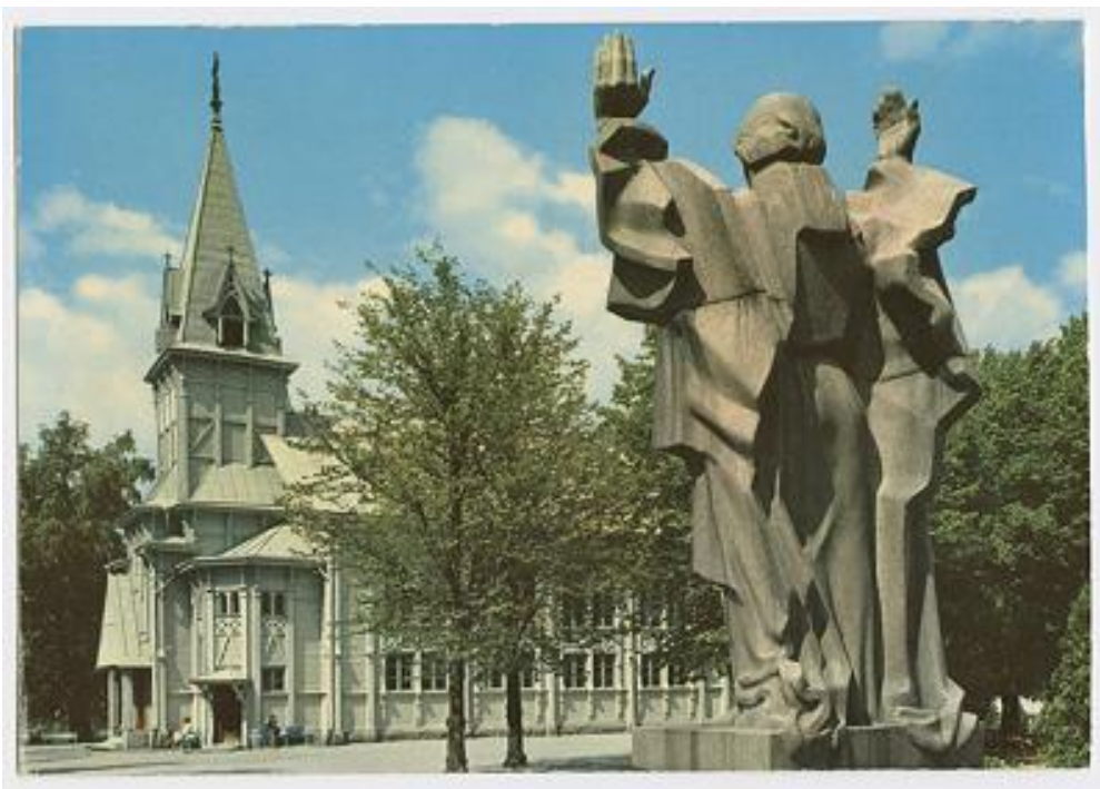
Kuva 4: Keski-Lahden kirkko kuvattuna 1975–1977. Edessä oikealla Vapauden hengetär -veistos.

Kirkon sisätilojen lisäksi muisteluaineistossa kerrotaan kirkon ulkopuolelle ja kirkkopuistoon liittyneistä muistoista ja kokemuksista. Kuva 4 on otettu kirkosta ulkoapäin viimeisinä vuosina ennen purkamista. Kirkko, sankarihautausmaa, Vapauden hengetär -veistos ja kirkkopuisto liittyivät läheisesti toisiinsa, ja olivat vuonna 1954 syntyneelle miehelle yksi kokonaisuus. Hän muistelee vanhaa puukirkkoa lapsuuden ja nuoruuden toimintaympäristönä. Hän oli lapsena hoidossa puistotädillä useiden muiden perheiden lasten kanssa kirkkopuiston leikkipaikalla. Kirkkopuisto eli ”Kirkkari” oli tärkeä paikka myös nuoruudessa. Muistelija kertoo leikkineensä Tarzania, Zorroa, Robin Hoodia, villin lännen sankareita sekä intiaaneja kavereidensa kanssa. He ampuivat jousipyssyllä ja nallipyssyllä, heittelivät tikkoja puihin, lennättivät lennokkeja, kiipeilivät kirkon katolle johtavilla tikkailla, laskivat liukua kirkon portaikon kaiteilla ja kiipeilivät puissa. Kirkon vahtimestari joutui toisinaan rauhoittamaan lapsijoukkoa. Välillä toiminta oli rauhallisempaa, kun joukkio makasi nurmikolla katsellen sinistä taivasta ja poutapilviä. 220 Muistitietoaineistossa tulee selvästi esille lapsuuden ja nuoruuden muistot huolettomista kesäpäivistä.