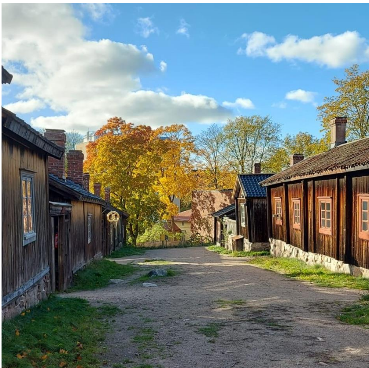
Kuva 1. Luostarinmäen ulkomuseoaluetta syksyllä 2023.

Tutkimusryhmän jäsenet olivat sopineet museon ja museokeskuksen henkilökunnan kanssa, että tutkimusta tehtiin arkisin virka-aikaan rajatussa osassa museoaluetta, kun museo oli suljettu talvikaudeksi syksyllä 2023. Näin tiedonkeruu ei häirinnyt museon normaalia toimintaa tai kävijöitä, eivätkä kävijät päätyneet vahingossa tutkimusvideoille.