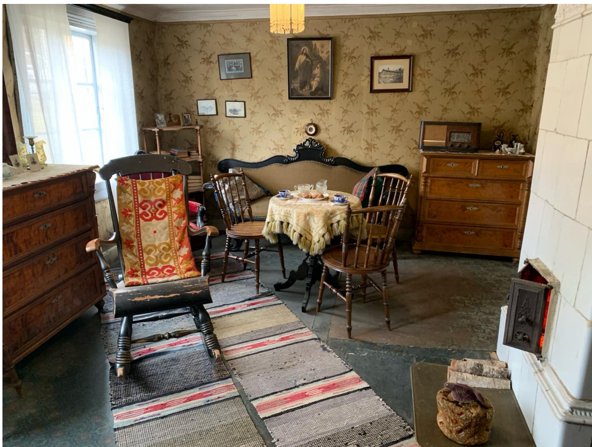
Kuva 3. Kanervon talon olohuone.