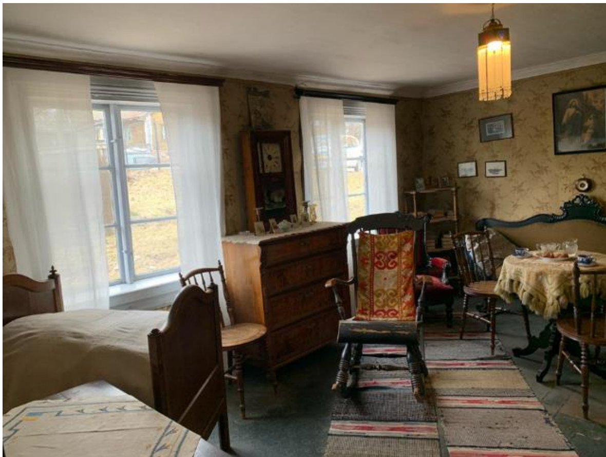
Kuva 9. Kuvassa Kanervon talon olohuone ja sen vasemmassa etunurkassa pieni, päästävedettävä sänky.

Kaikki osallistujat pyrkivät mainosteksteissään ennen vierailua lisäämään oppilaiden tunteita ja odotuksia vierailua kohtaan. Tämä tuli joissakin vastauksissa tuli esille myös siten, että osallistuja halusi säilyttää vierailussa yllätyksellisyyttä olemalla paljastamatta siitä liikaa etukäteen. LO1:n vastaukset erosivat muiden vastauksista siten, että hän ideoi oppilaille ennakkotehtävän ja tavoitteita jo ennen vierailua. Tähän saattoivat vaikuttaa hänen erityispedagogiikan opintonsa. Itsemääräämisteorian elementeistä useammassa mainostekstissä tuli esille yhteisöllisyyttä ja autonomian kokemuksen vahvistamista.