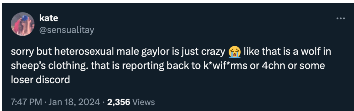
Kuva 1 Fani jakaa twiitissä ajatuksiaan siitä, miten heteromies sopii gaylor-faniyhteisöön. Kuvakaappaus X:stä.

Yhdistäviä tekijöitä neuvotellaan gaylor-yhteisössä esimerkiksi viestimällä käsityksistä muista yhteisön jakamista identiteettitekijöistä, kuten sukupuoli- ja seksuaalisesta identiteetistä. Käyttäjä @sensualitay (18.1.2024) kertoo twiitissään pitävänsä älyttömänä ajatusta, että gaylor olisi heteromies (ks. kuva 1). Toinen fani rakentaa käsitystä yhteisöstä viittaamalla yhteisön jäseniin sanalla ”gays” (@1989gaylor 8.2.2024). Twiitit rakentavat kuvaa tyypillisestä gaylorista ja tämän asenteista. Faneille vaikuttaa olevan haastavaa kuvitella hyvää motiivia sille, miksi valtaväestöön sukupuolen ja seksuaalisen suuntautumisen puolesta kuuluva henkilö osallistuisi queer-näkökulman ottavaan toimintaan. Antaahan toisin lukeminen juuri ”mahdollisuuden löytää myös marginalisoiduille ryhmille mielekkäitä tulkintoja valtavirralla suunnatuista teoksista” (Hänninen 2021:54), vaikka näkökulman voikin ottaa kuka vain identiteetistä riippumatta.