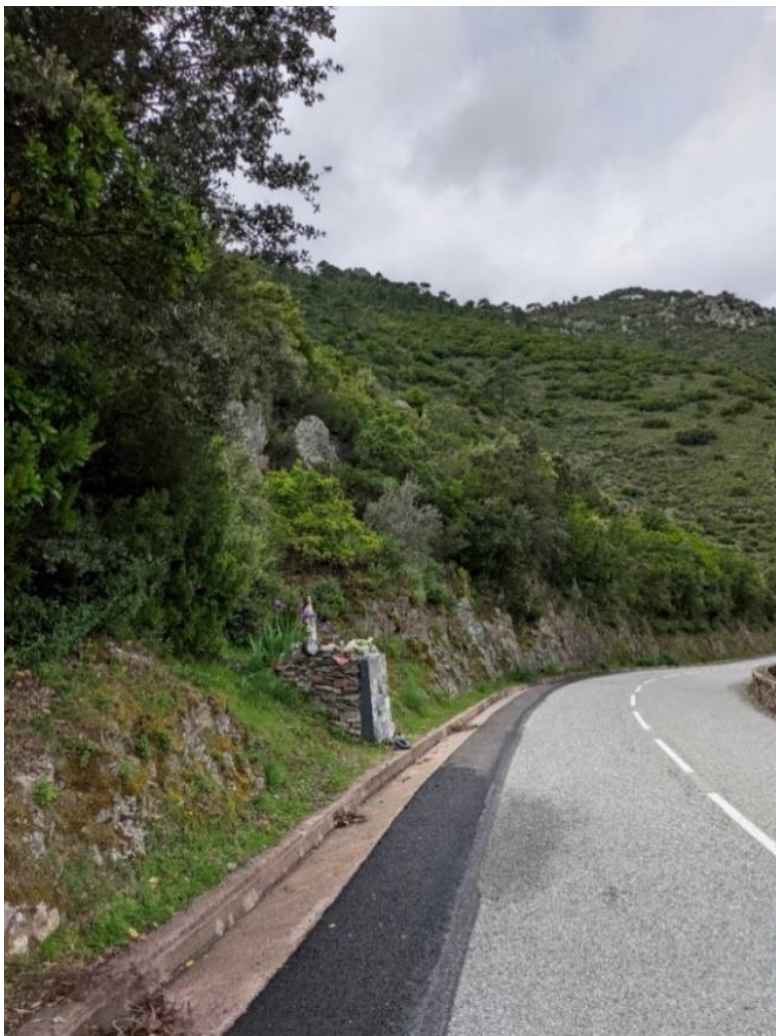
Kuva 1. Henri Toivosen ja Sergio Creston tienvarsimuistomerkki D18-tien sisäkaarteessa 2.5.2024.

poiketen, marmorinen virallinen muistomerkki löytyy turvallisemmasta paikasta onnettomuusmutkan sisäkaarteesta (kuva 1).