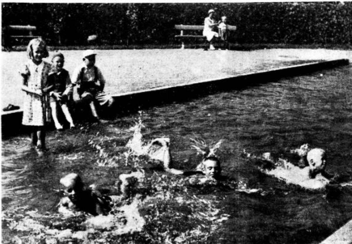
Kuva 4. Alkuperäinen kuvateksti: "Kahlauslammikko on lämpiminä suvipäivinä lasten suuressa suosiossa, sillä se tarjoaa mahdollisuudet virkistymiseen ja hauskaan polskuttelemiseen."

Tässä luvussa olen tuonut esille Mikaelinkirkon aukean kentällä suoritettuja toimenpiteitä, joista kirjoitettiin sanomalehdissä. Lehdet viestivät kaupungin lasten hyväksi tekemistä toimista ja toisaalta myös kritisivat toimimattomuutta. Toimenpiteistä uutisointi on myös viestittänyt ihmisille leikkikenttien tärkeydestä. Toimenpiteiden tarkoituksena on ollut luoda kentästä nimenomaan lasten paikka. Heidän tarpeitaan huomioitiin kentän muutoksissa. Lasten viihtyvyyteen panostettiin asentamalla kentälle kiinteitä leikkivälineitä ja kahluuallas. Sanomalehtien leikkikenttäkuvien perusteella kiinteät välineet myös muuttivat ohjatun leikin luonnetta. Kiinteiden leikkikalusteiden myötä lapset saattoivat käyttää leikkikenttää paitsi itsenäisesti, myös uudesta perspektiivistä käsin. Leikkikentän horisontaalisen käytön ohella keinujen ja kiipeilytelineiden myötä lapsille tarjoutui mahdollisuus myös vertikaalisen tilan haltuunottoon. Mikaelinkirkon aukean leikkikentän kahluuallas toi lasten ulottuville myös vesielementin kaupungin kivierämaan keskelle. Kiinteät leikkikalusteet lisäsivät lasten toimintamahdollisuuksia leikkikentällä ja laajensivat leikin ulottuvuuksia.