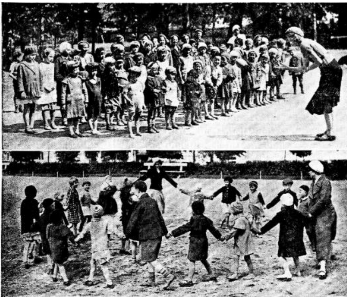
Kuva 1. Alkuperäinen kuvateksti: "Lapset leikkimässä. Lastensuojelulautakunnan leikkikentät ovat jo vilkkaasti käytännössä. Yllä pari kuvaa, toinen Kupittaaalta, toinen Mikaelinkirkon aukealta eilispäivänä."